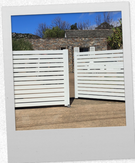
Automatismes Corses - portail battant, Tramontane

Vérand'Innov - pergola bioclimatique, gamme Signature