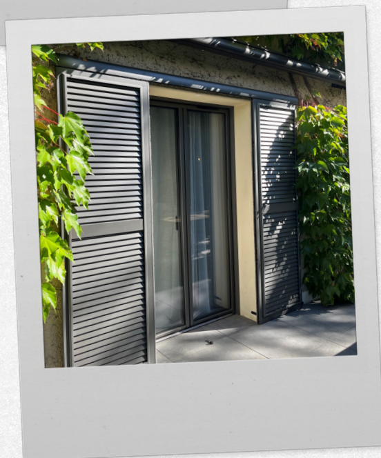
Isère Automatismes - volets coulissants gamme Éléance, modèle Grenat