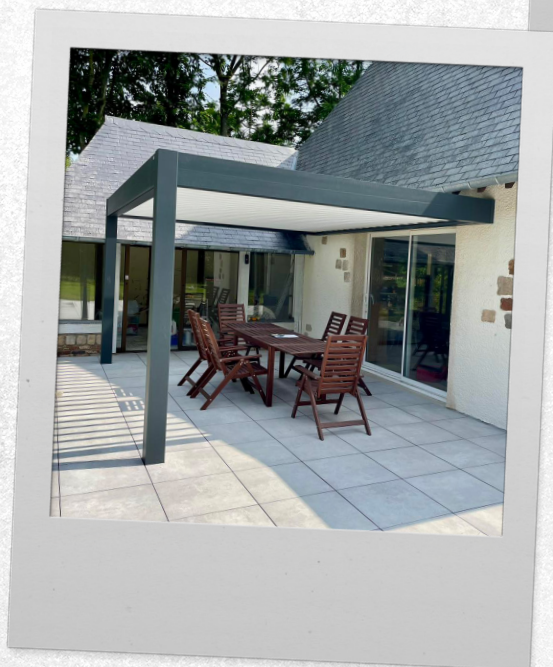
Héranval - pergola bioclimatique, gamme Signature