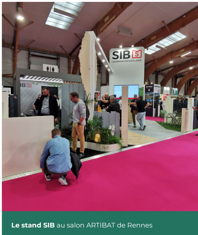
Le stand SIB au salon ARTIBAT de Rennes