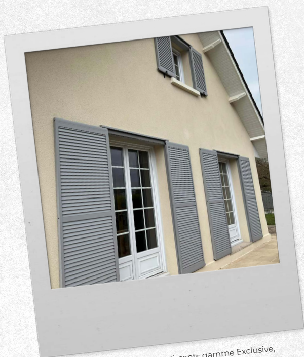
Entreprise Louro - Volets coulissants gamme Exclusive, modèle Elbrouz (aspect persienné)

Suivez-nous et envoyez vos plus belles photos sur instagram @portailsib