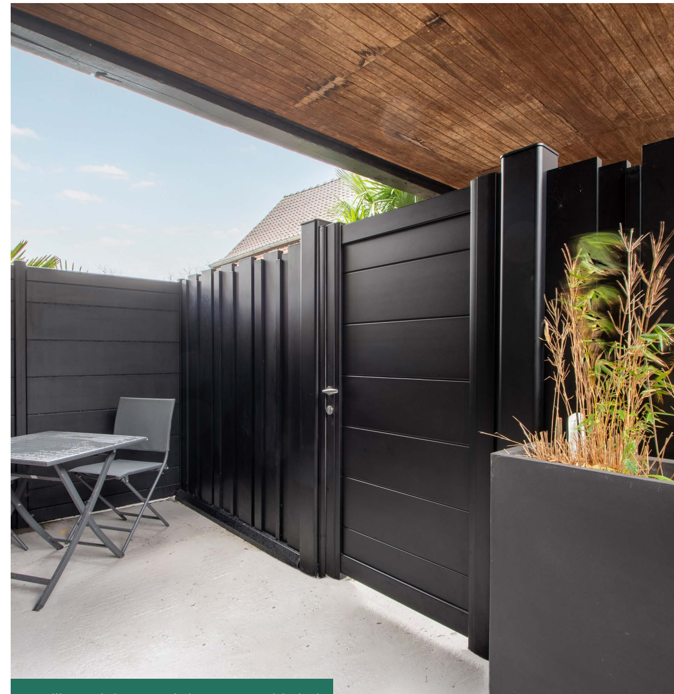
Portillon Origin 255 et brise-vue Graphic (59)

Extérieur(s) - Novembre 2022 Responsable de la publication : Cécile Rousseau Rédaction : Camille Lockhart Création / exécution : nobilito - nobilito.fr