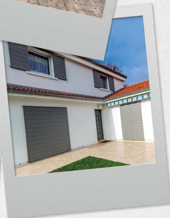
pidoux - Volets coulissants Exclusif Rhône