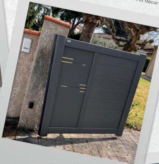
ALS 47 - Portail avec gonds régulateurs de pente et décor Horizon Lot-et-Garonne