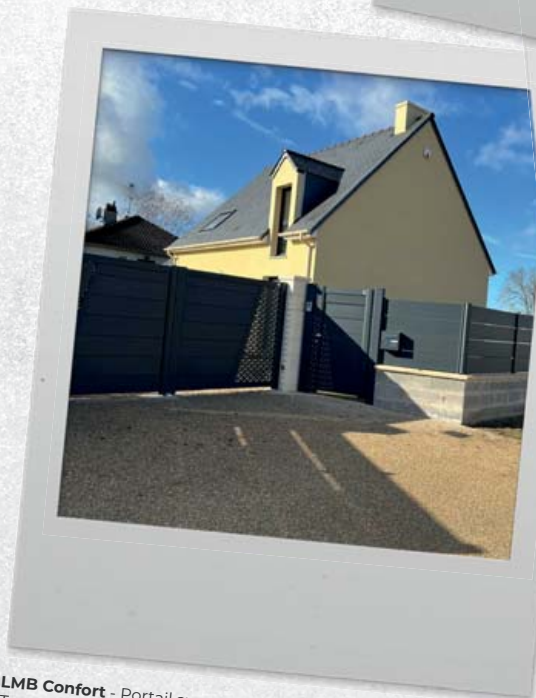
LMB Confort - Portail avec décor Bulles de savon et clôture Tramontane 250 - Yvelines