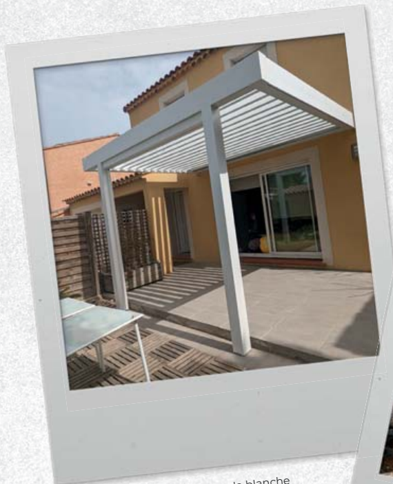
Axe&Lise Rénovation - Pergola blanche Bouches-du-Rhône

Suivez-nous et envoyez vos plus belles photos sur instagram @portailsib