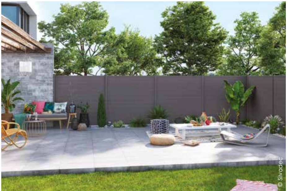
Les clients veulent se sentir dans leur jardin comme dans un cocon, à l'abri des regards indiscrets. L'aluminium est alors un matériau de choix en combinant design, esthétique et durabilité.