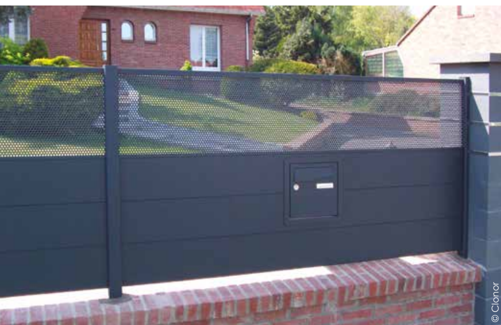
Clonor fabrique des clôtures aluminium haut de gamme et sur-mesure. Elles présentent une finition texturée avec un thermolaquage par poudre polyester haute adhérence, pour une grande résistance aux micro-rayures.