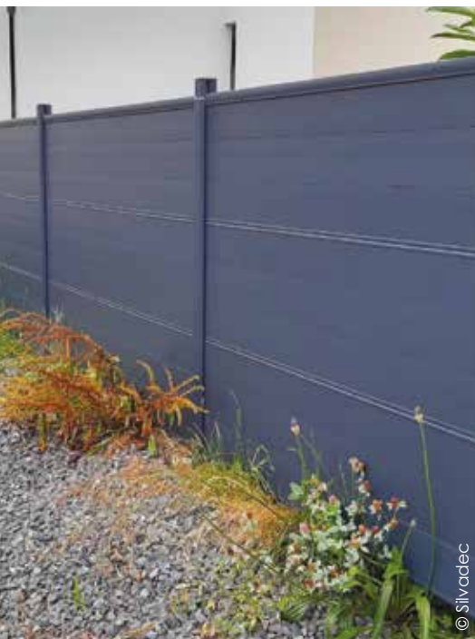
La lame écran Aluminium de Silvadec est en aluminium thermolaqué certifié Qualicoat® (garantie de 10 ans), avec une finition sablée de qualité, structurelle et durable.