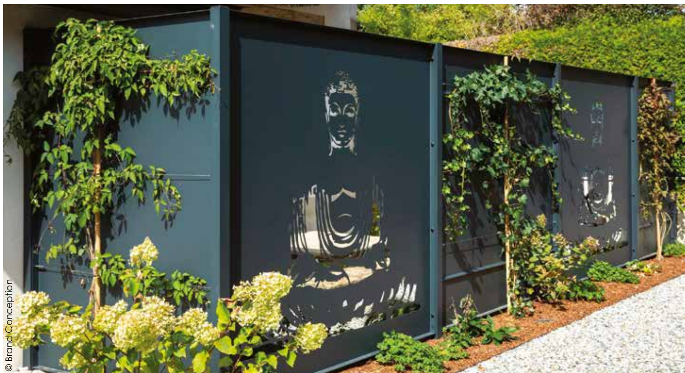
Sérénité et intimité, c'est ce que propose le modèle de panneau en aluminium Mugo de Brand Conception. Sa finition, en texture fine, évite les micro-rayures.

Durable et personnalisable à souhait (couleurs, finitions, découpes...), l'aluminium est décliné à travers de nombreux modèles proposés par les fabricants. Il apporte une touche design très appréciée par les clients afin de créer un cocon unique.