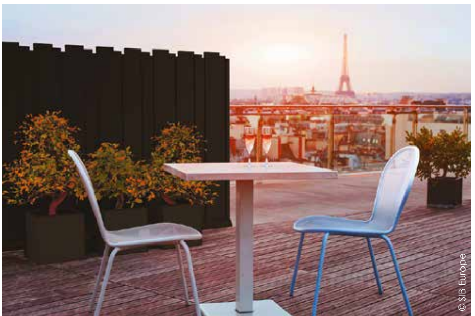
Inspirée des palissades en bois, la clôture Graphic de SIB Europe est en aluminium thermolaqué avec des poudres de peinture de qualité classe 2 ce qui garantit une excellente tenue des couleurs face aux UV et aux intempéries.