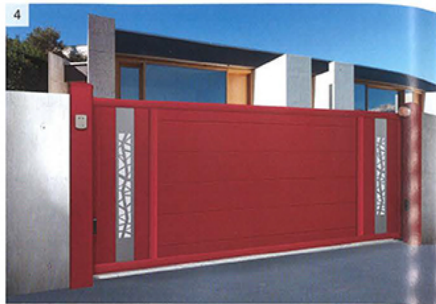
4-SIB. Le choix des finitions avec décor aluminium.